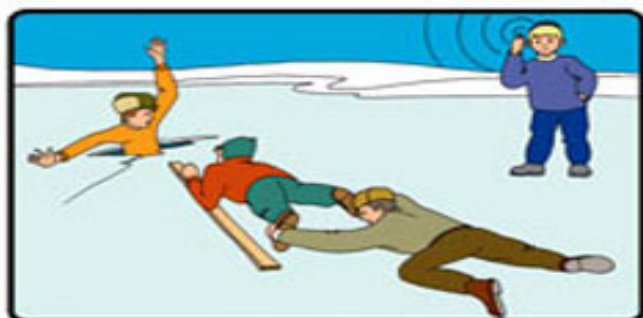
ПОДАВАЙТЕ СПАСАТЕЛЬНЫЙ ПРЕДМЕТ С 3-4 МЕТРОВ