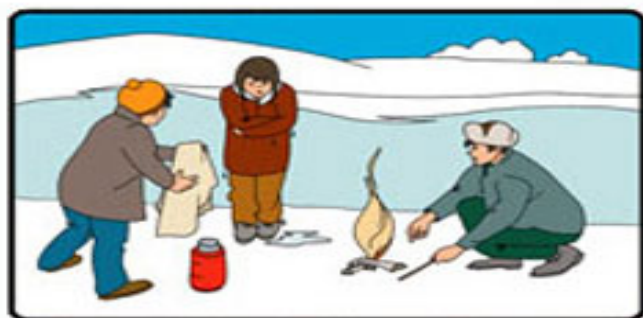
ОБОГРЕЙТЕ ПОСТРАДАВШЕГО И ВЫЗОВИТЕ СПАСАТЕЛЕЙ