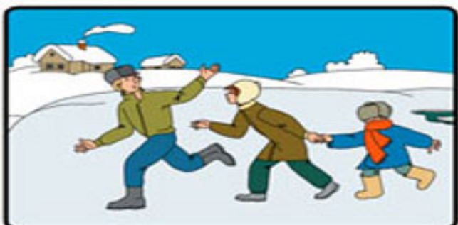
СРОЧНО СЛЕДУЙТЕ В БЛИЖАЙШЕЕ СЕЛЕНИЕ