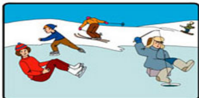
НЕ ДОПУСКАЙТЕ ОБМОРОЖЕНИЯ И ЗАМЕРЗАНИЯ