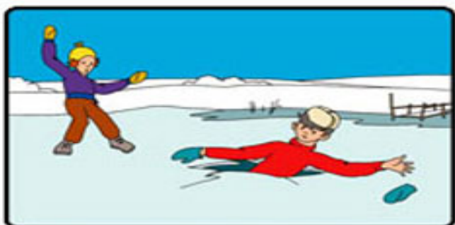
НЕ ПОДАВАЙТЕСЬ ПАНИКЕ БЕРЕГИТЕ СИЛЫ !

Соблюдение правил поведения на водных объектах, выполнение элементарных мер осторожности - залог вашей безопасности!